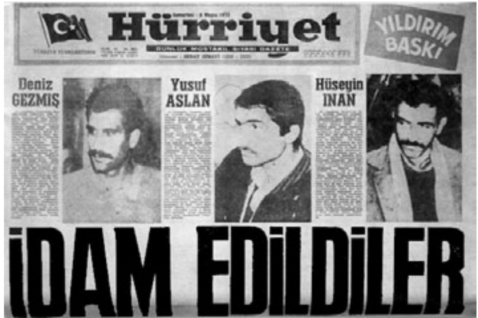
DENİZ GEZMİŞ YUSUF ASLAN HÜSEYİN İNAN 6 Mayıs 1972 / Ankara