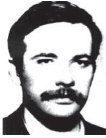
MAHİR ÇAYAN 1946 Samsun